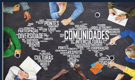
mês internacional das bibliotecas escolares Ligando comunidades e culturas