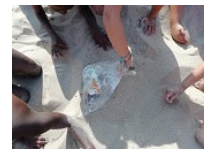
1º ciclo: 3ºano na recolha do lixo...